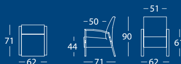
SILLÓN ARMCHAIR 133.621